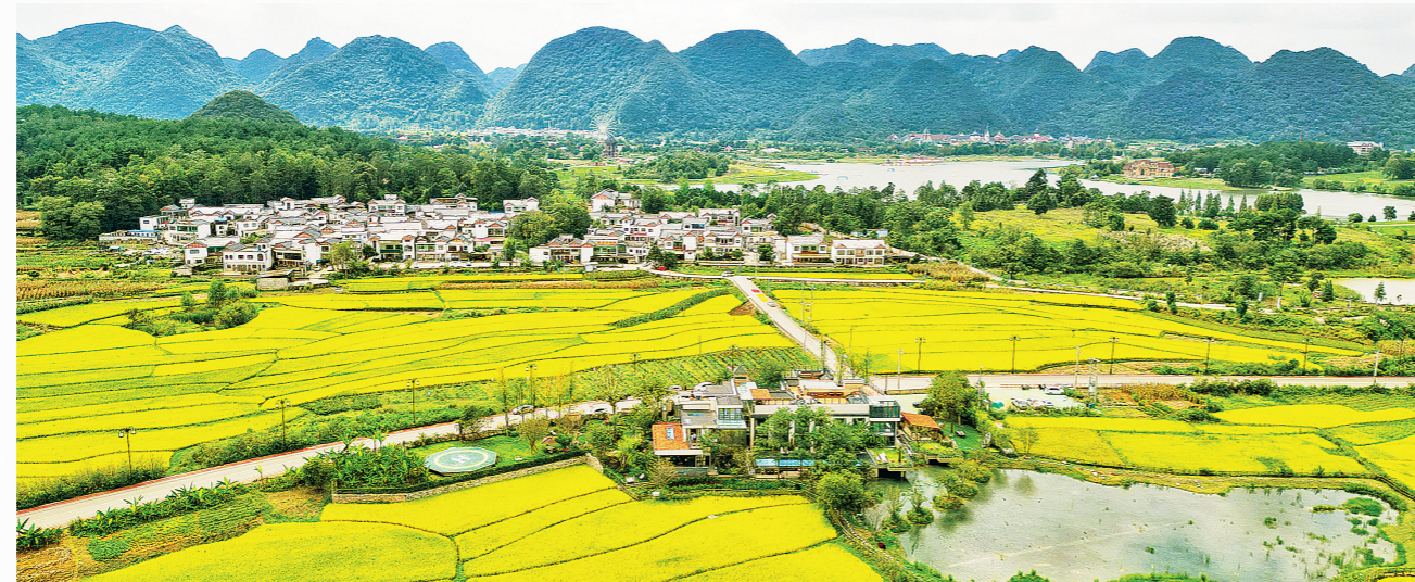
贵安新区马场镇平寨村景色。

生态气候方面，贵安新区是名副其实的“天然空调房”和“生态氧吧”，万亩樱花园、云漫湖、月亮湖等生态资源密布，四季景致宜人，为“睡个好觉”构筑了优质自然基底。交通区位方面，贵安新区地处黔中腹地，轨道交通S1线、贵安高铁枢纽与“八横七纵”路网高效衔接，形成半小时贵阳通勤圈和两小时西南城市群生活圈，让“快出行、慢生活”