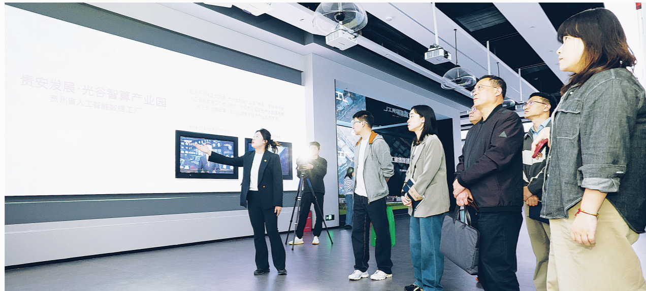
与会嘉宾实地走访贵州省人工智能数据工厂。

本次对接会以政府搭台、企业出招、院校育才为模式,推动“四城”资源共享、优势互补。贵州数策智算、领泓智能、数据宝等10余家数据标注领域重点企业,现场发布数据标注工程师、AI训练师等优质岗位,精准匹配院校人才培养方向。贵州数策智算科技有限公司总经理马欣伟介绍,5月公司计