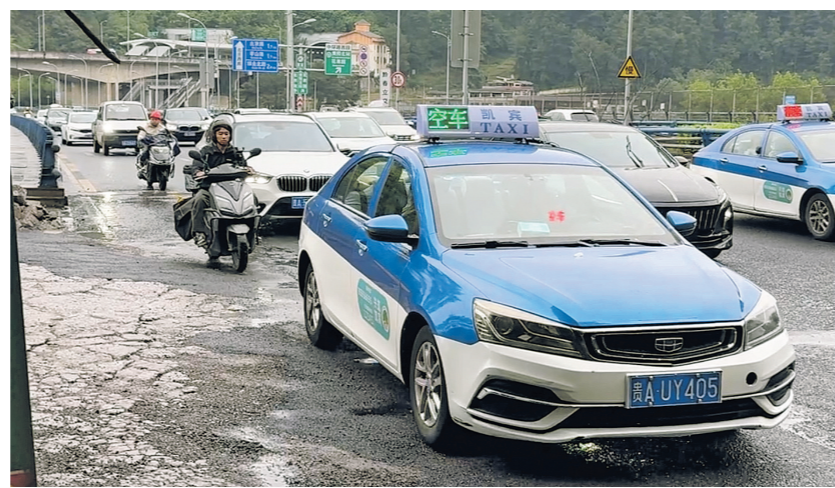
黔春隧道入口路面破损导致车辆减速避让，存在安全隐患。

“融媒+督查”工作组将持续关注该路段路面的长效维护情况。