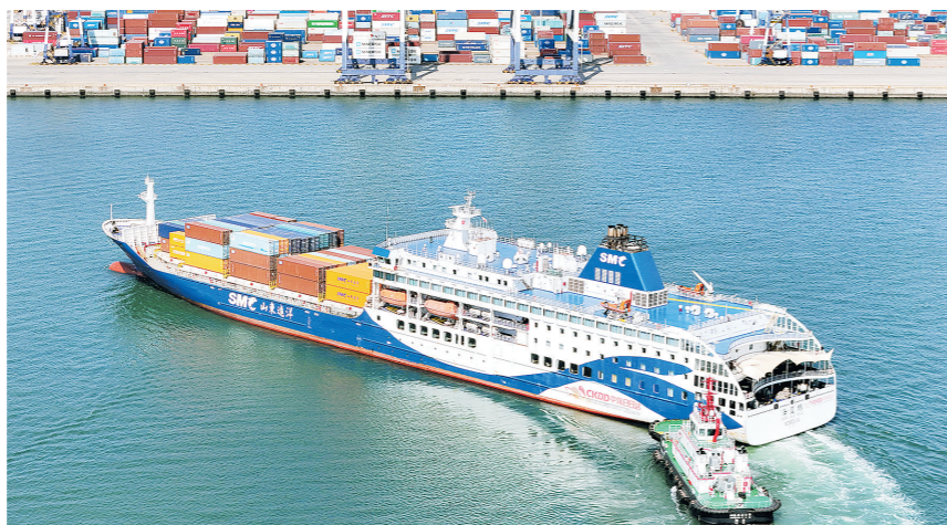
5月9日，一艘“中韩日达”班轮靠泊山东港口烟台港（无人机照片）。

前4个月，民营企业进出口总值达9.31万亿元，同比增长15.9%，占我国外贸总值的57.4%，继续保持我国第一大外贸主体地位；同期，外商投资企业进出口增长15.4%，表明我国始终是全球