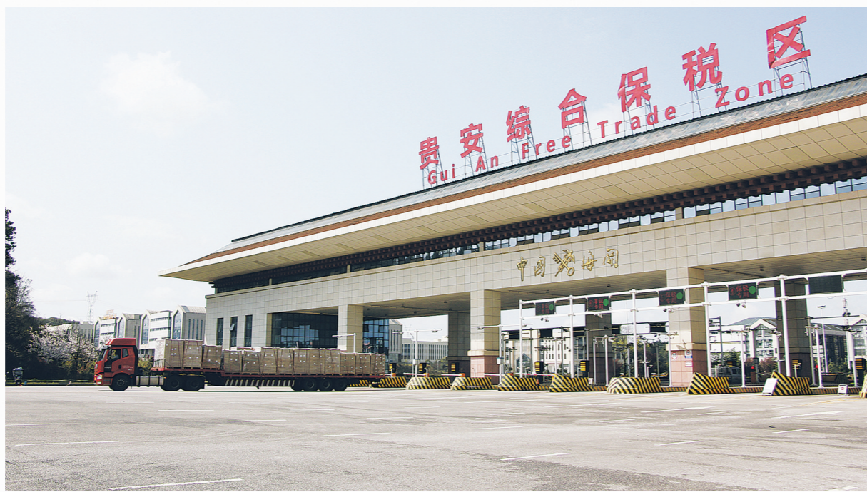
3月10日，一批货物从贵安综保区海关卡口出关。

名单中，贵安新区国家加工贸易产业园（由贵安综保区申报）成功入选，这既是贵安综保区获得的又一块国家级金字招牌，也是贵安综保区建强开放平台的例证。此外，在扩大开放主体方面，贵安综保区在现有的开放主