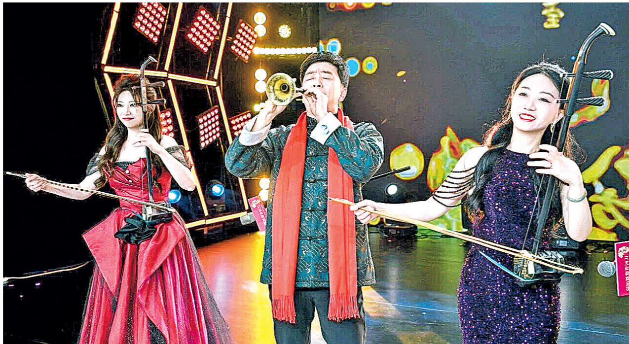
江西省歌舞剧院团播现场。

43家省市级广播电视台、789位专业电视台主持人入场抖音直播,丰富平台读书分享、音乐电台等文化类内容供给;800多位不同领域的艺术家走进直播间,为观众带来高水准的艺术分享;499家国有院团携手6183名专业演员,在全国开展80多万场直播,让大量经典文艺作品通过云端走进大众生活;1.6万名演艺行业内的专业人士,累计开播超过300万场,内容覆盖民乐、中国舞、乐器等多个艺术门类——当