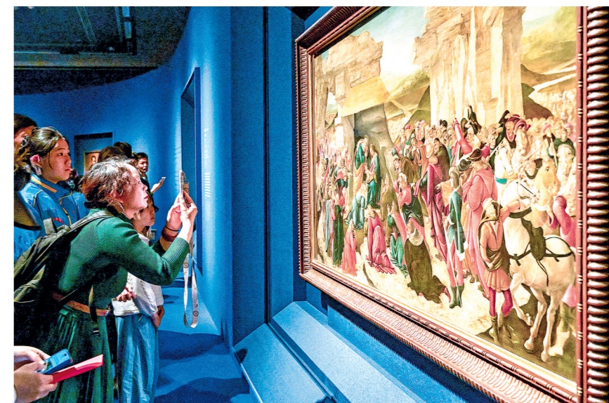
观众参观波提切利的作品《三博士来朝》。 新华/传真