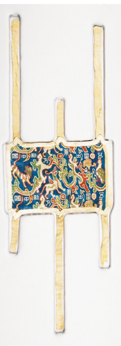
“五星出东方利中国”锦护臂。

经过专家分析和鉴定，“五星”织锦护臂是由五组经线 and 一组纬线织成的五重平纹织锦。这种织法在汉锦中较复杂，极为罕见。其纹样题材异常别致，有凤凰、鸾鸟、麒麟、白虎等瑞兽和祥云瑞草，并巧妙地将“五星出东方利中国”等篆体文字列置其间。