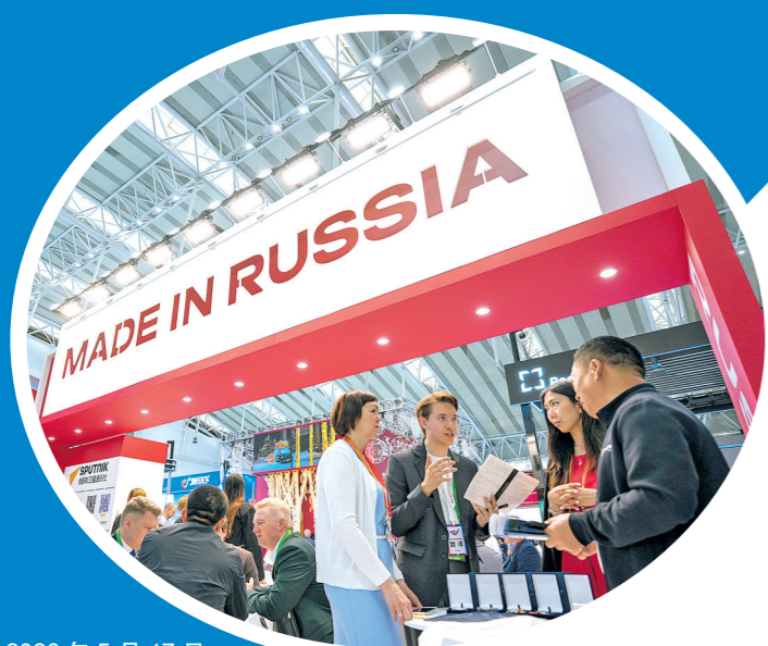
2026年5月17日,参会者在第十届中国—俄罗斯博览会展览现场交流洽谈。