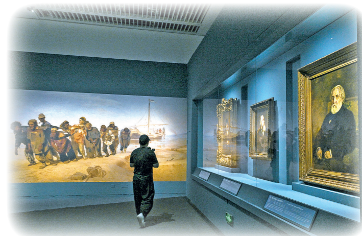
2025年7月22日,作为2024—2025“中俄文化年”的重点项目之一,由中国国家博物馆与俄罗斯特列季亚科夫画廊联合主办、俄罗斯国家博物馆支持的“涅瓦河畔的遐思——列宾艺术特展”开幕式在北京中国国家博物馆举行。