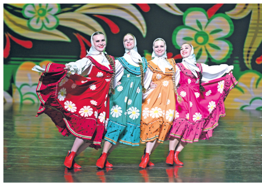
2024年6月22日,2024—2025“中俄文化年”海南岛欢乐节俄罗斯艺术团体巡演在海口市举行,俄罗斯斯塔夫罗波尔州“伊夫什卡”国立模范歌舞团为观众带来极具俄罗斯地方民族特色的演出。