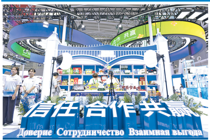
2026年5月17日,参会者在第十届中国—俄罗斯博览会现场参观。