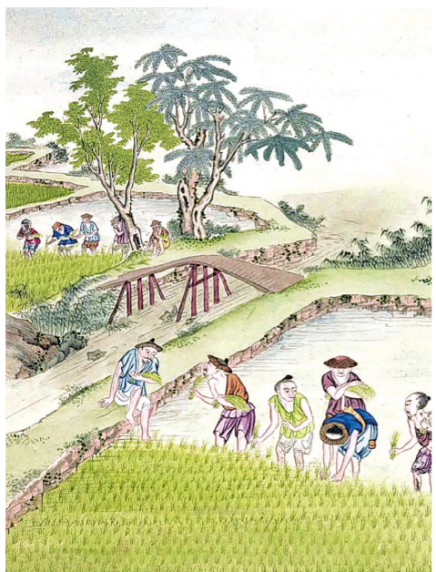
清代《耕织图》中农民插秧种稻的情景。

不管是阳气小满，还是籽粒小满、江河小满，都是后人对小满节气考证后的推理解释。小满节气的命名释义，反映了不同朝代、不同地区，人们思想、生产生活及社会认知的变化。