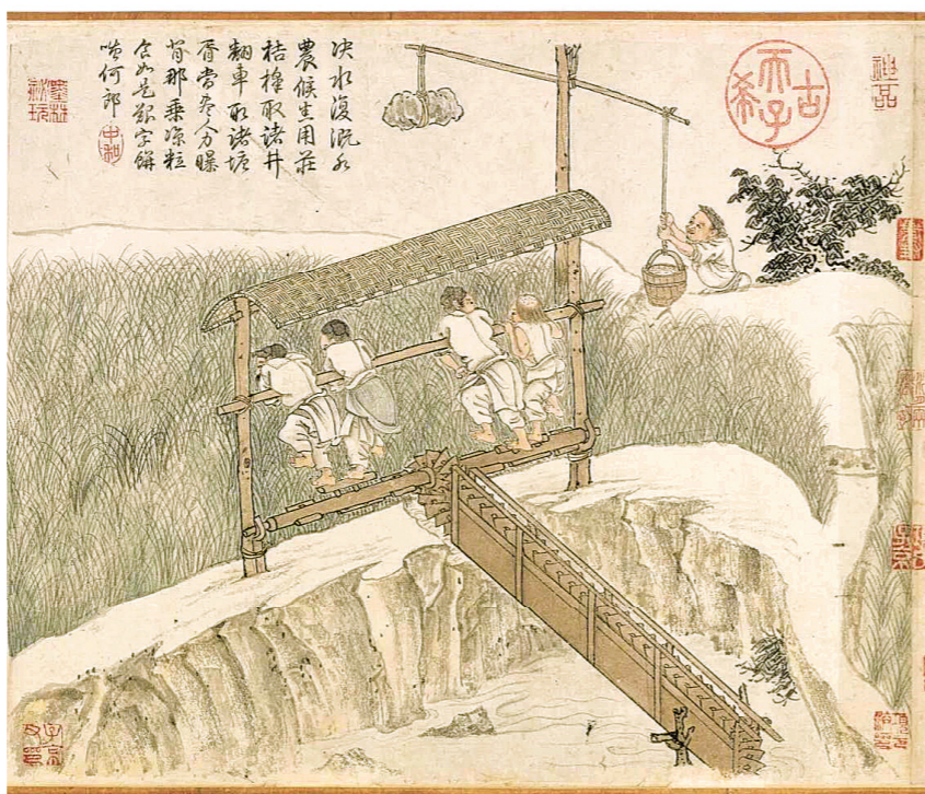
元代程棡（音qi）摹南宋楼璘（音shu）《耕织图》之《祭水车神图》。