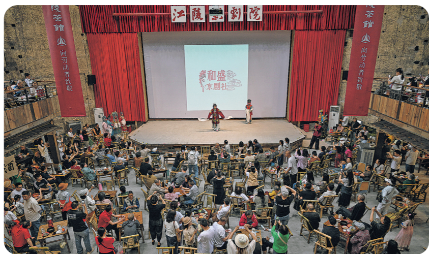
2026年5月10日,人们在重庆两江新区大石坝江陵茶馆内欣赏京剧。