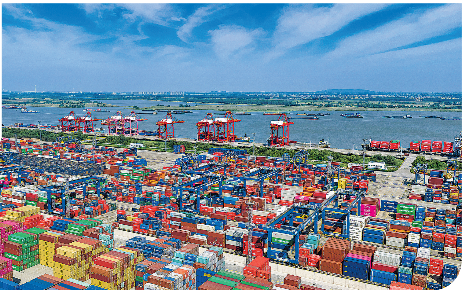
2026年5月17日拍摄的江苏省港口集团南京港龙潭码头作业场景(无人机照片)。

城市是经济增长的重要引擎,也是观察大国经济质量的重要窗口。近期以来,我国各大城市一季度经济数据相继公布——上海、北京地区生产总值(GDP)双双突破万亿元;广州GDP增速位居一线城市前列,新旧动能转换成效初显;西安、重庆、深圳外贸增速分别达74.2%、34.3%、33.6%;武汉规模以上高技术制造业增加值增长45.4%……一组组亮眼数据,彰显发展成效。习近平总书记强调,要以新发展理念引领发展,加快培育新动能,促进经济结构优化升级,做优增量、盘活存量,保持质的有效提升和量的合理增长。从城市观成色。各大城市推动高质量发展的新进展新气象,折射“十五五”开局之年我国经济的强劲脉动,印证中国经济在复杂外部环境下稳健前行的韧性与活力。