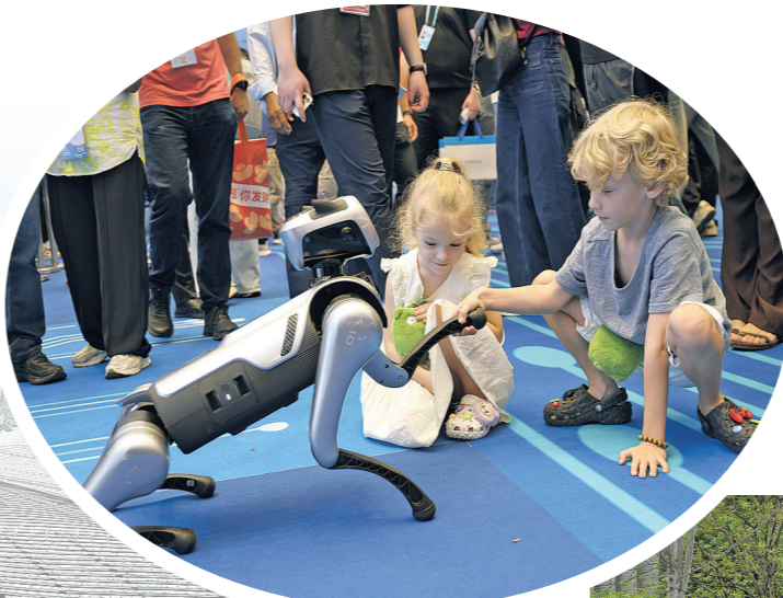
2026年4月15日,小朋友在广州举行的第139届中国进出口商品交易会上和机器狗握手。 2026年4月18日,人们在上海市静安区万象天地花卉市集上游览。