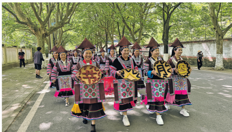
身着少数民族特色服饰的村民。

喜庆的节日氛围。 本次活动共有洋塘村及周边村寨的40余组表演队伍参与，以传统民俗为载体，传承弘扬少数民族优秀传统文化，进一步丰富了群众的精神文化生活，增进了邻里情谊。下一步，洋塘村将持续依托传统民俗节庆，开展群众喜闻乐见的文体活动，持续推动乡村文化建设，不断提升群众的幸福感和获得感。 （贵阳日报融媒体中心记者 田甜 文/图）