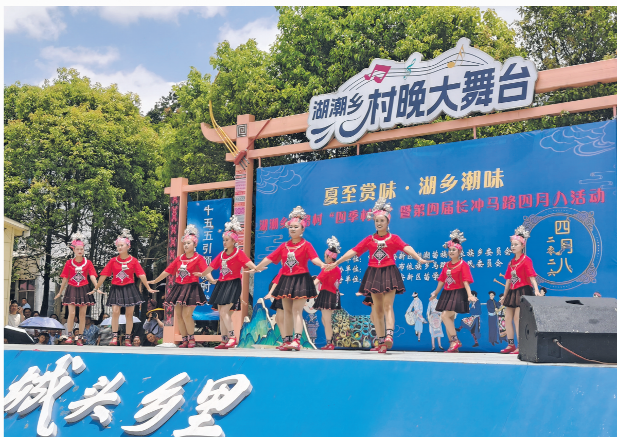
马路村“四月八”活动现场。

本报讯 5月24日，贵安新区湖潮乡马路村“四季村晚”暨长冲马路第四届“四月八”活动在马路村文化广场举行。 当天，活动以一场民俗巡游拉开序幕。巡游队伍集结了湖潮乡各村寨群众与非遗传传承人，大家身着传统服饰，沿着乡道行进，展现各民族交融共生、团结奋进的良好风貌。 随后，文艺汇演拉开帷幕。湖潮乡各村群众、花溪大学城高校师生和贵阳贵安文艺爱好者轮番登台，接连上演笙舞、苗族山歌、地戏等精彩节目，生动展现贵安新区乡村日新月异的发展变化和各族安居乐业的幸福图景。 在文艺汇演舞台一旁，“潮味集市”同步开市，设置了美食品尝、民族服饰展销、特色农产品与工艺品展销等区域，品类丰富、业态多元。 此次活动既是对苗族“四月八”民俗文化的传承，也是湖潮乡打造“四季村晚”常态化、品牌化的生动实践。下一步，湖潮乡将持续深耕民族文化资源，依托“湖乡潮味”文化品牌，推动农旅文旅深度融合，不断丰富乡村文化供给，以文化赋能乡村振兴，让新时代乡村焕发更绚丽的光彩。