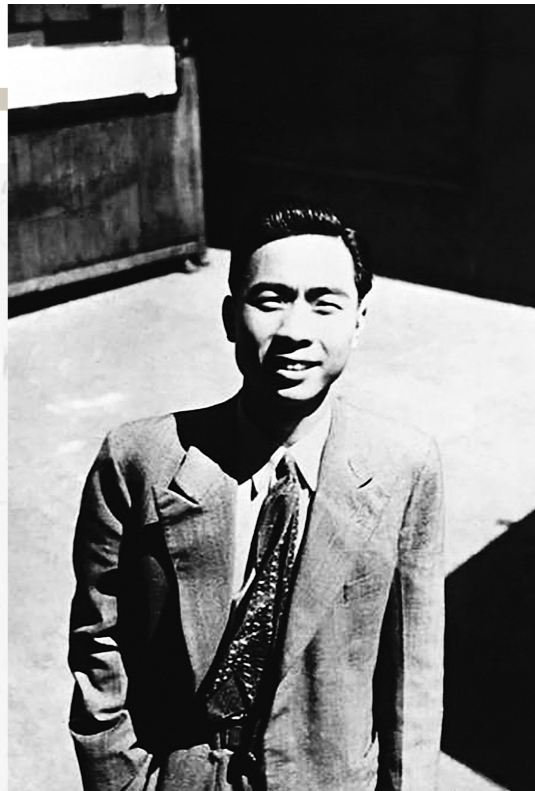
汪曾祺上世纪四十年代在上海。