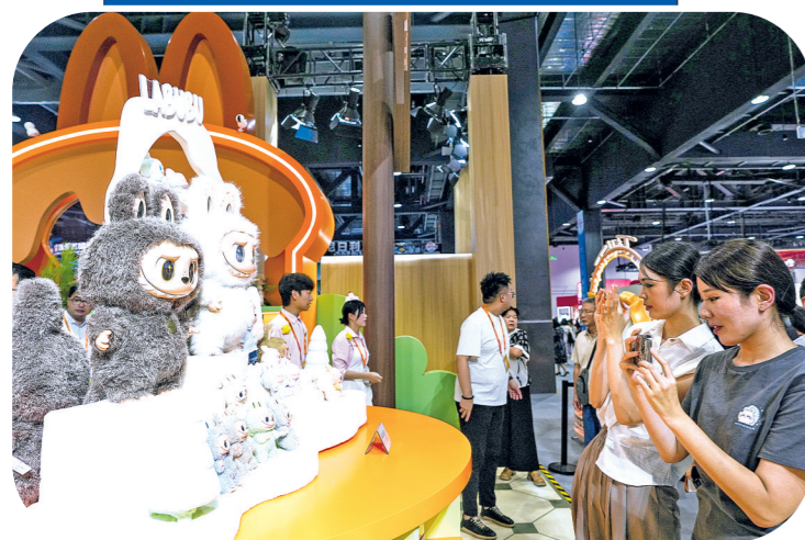
2025年9月12日,在2025服贸会泡泡玛特展位,参观者拍摄LABUBU玩偶。