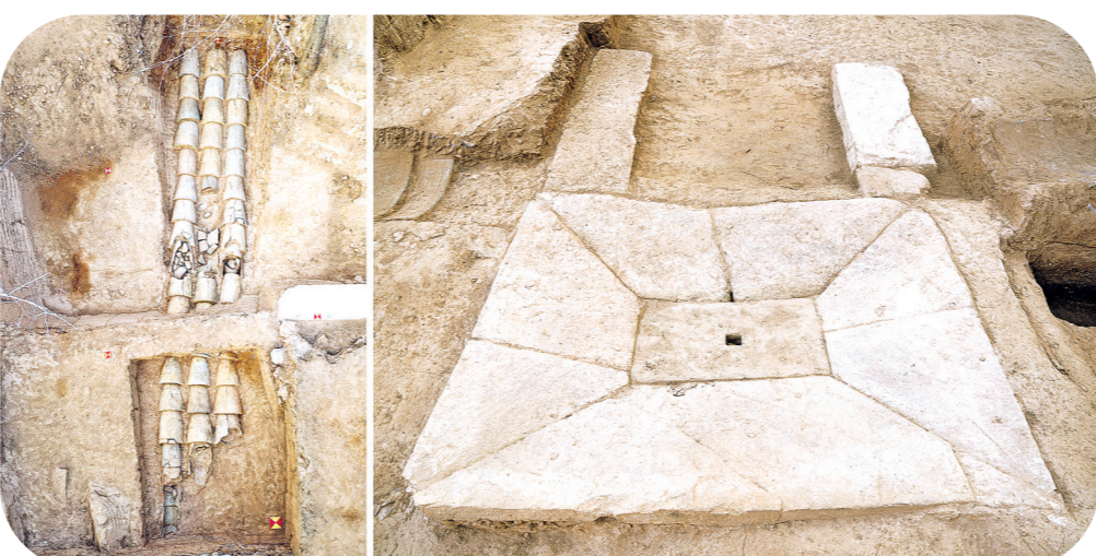
山东青岛琅琊台遗址山顶建筑基址发掘出土的排水设施(资料照片,拼接照片)。

沿着习近平总书记指引的方向,承载着深厚历史底蕴与鲜明时代精神的中华文化,必将焕发新气象、铸就新辉煌,为以中国式现代化全面推进强国建设、民族复兴伟业筑牢文化根基,为促进人类文明进步、构建人类命运共同体贡献更多中国智慧与东方力量。