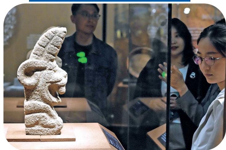
2026年5月17日,观众在首都博物馆参观“玉米·黄金·美洲豹——玛雅与安第斯古代文明”大展。