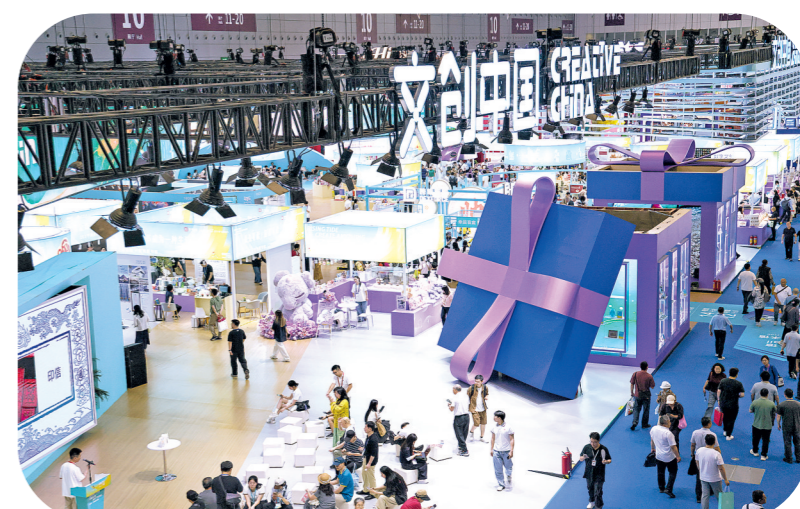
第二十二届中国(深圳)国际文化产业博览交易会“文创中国”展区(2026年5月22日报)。