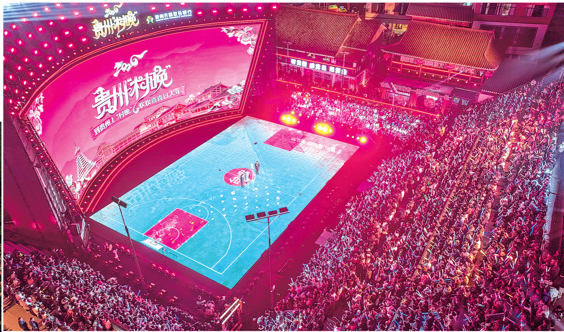
2026年2月3日,观众在贵州省台江县台盘乡“村BA”球场观看贵州“村晚”(无人机照片)。