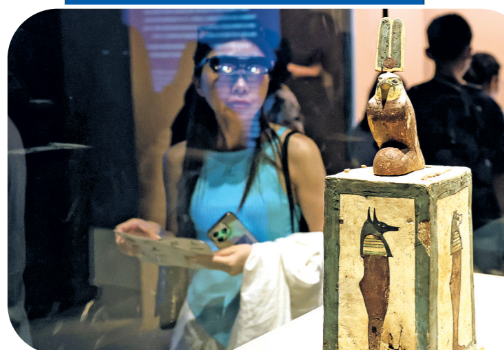
2025年8月17日,佩戴导览智能眼镜的观众在上海博物馆参观“金字塔之巅:古埃及文明大展”。