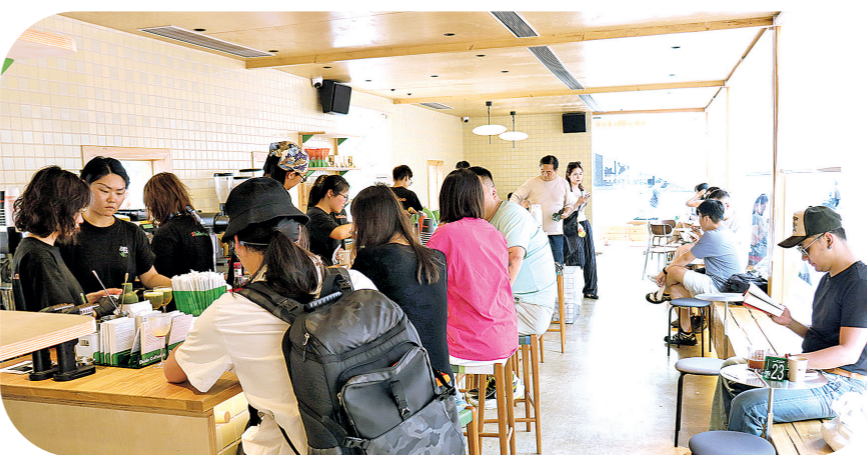
位于阿云朵仓的对的咖啡店内座无虚席(资料图片)。