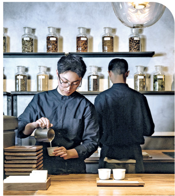
乔治队长咖啡“风味博物馆”咖啡师正在制作咖啡(资料图片)。