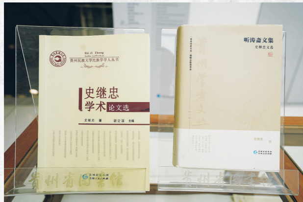
“史继忠学术文献展”上展示的两部学术文集。