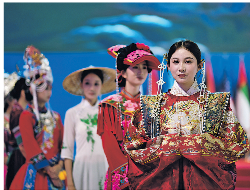
6月12日，2026丝路云裳·南博时装周在昆明滇池国际会展中心开幕。本次时装周以云南楚雄彝绣为纽带，汇聚国内外服饰文化精华，展现传承与创新、传统与现代、非遗与时尚、技术与艺术的融合之美。