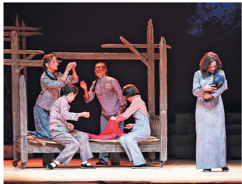
6月11日，由中国文联戏剧艺术中心指导、中国国家铁路集团有限公司党组宣传部监制、中国铁路文工团出品的经典话剧《红岩》在上海同济大学上演。剧目以舞台艺术为载体，把厚重历史与信仰力量搬进校园，用红色话剧打造思政新课堂，让红岩精神走进青年学子心中。