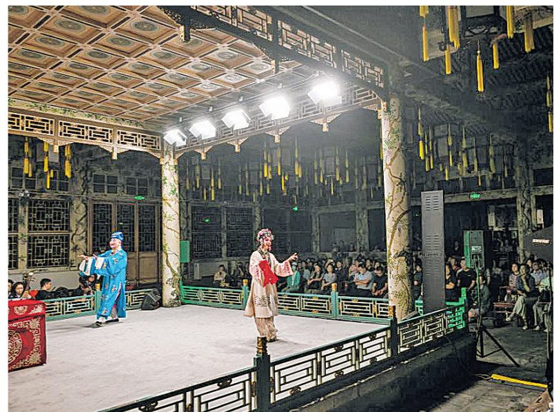
6月9日，第十九届“良辰美景·恭王府非遗演出季”在北京恭王府大戏楼启幕。本届演出季共包含三场古琴展演、三场昆曲展演，让观众在古建中感受非物质文化遗产的魅力。