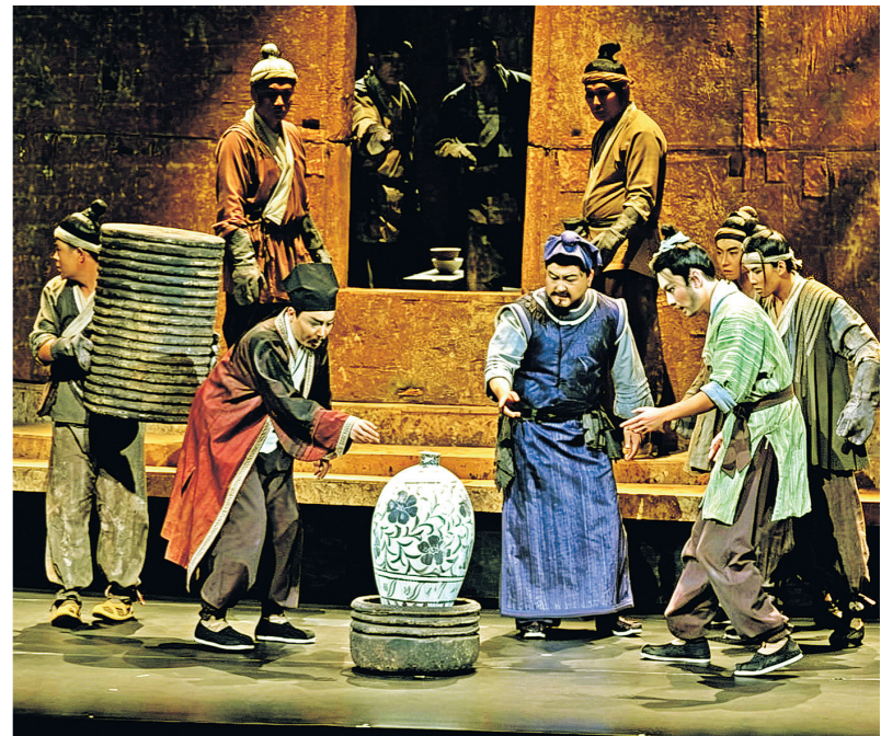
近日，由河北省话剧院创演的话剧《磁州窑》在石家庄人民会堂上演。该剧深挖邯郸磁州窑千年文脉，融入武安落子非遗唱腔，讲述制瓷匠人的故事。