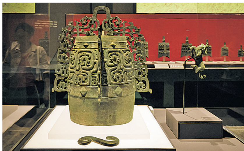
带有“秦公”铭文的青铜罍。

一侧展柜中陈列的一件出土自陕西宝鸡周原遗址的西周时期的卜甲，是目前考古发现中最早明确出现“秦