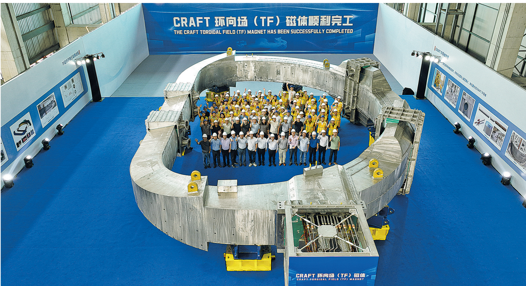
2026年6月27日，中国科学院合肥物质科学研究院等离子体物理研究所聚变堆环向场超导磁体项目组成员和验收组专家合影（无人机照片）。